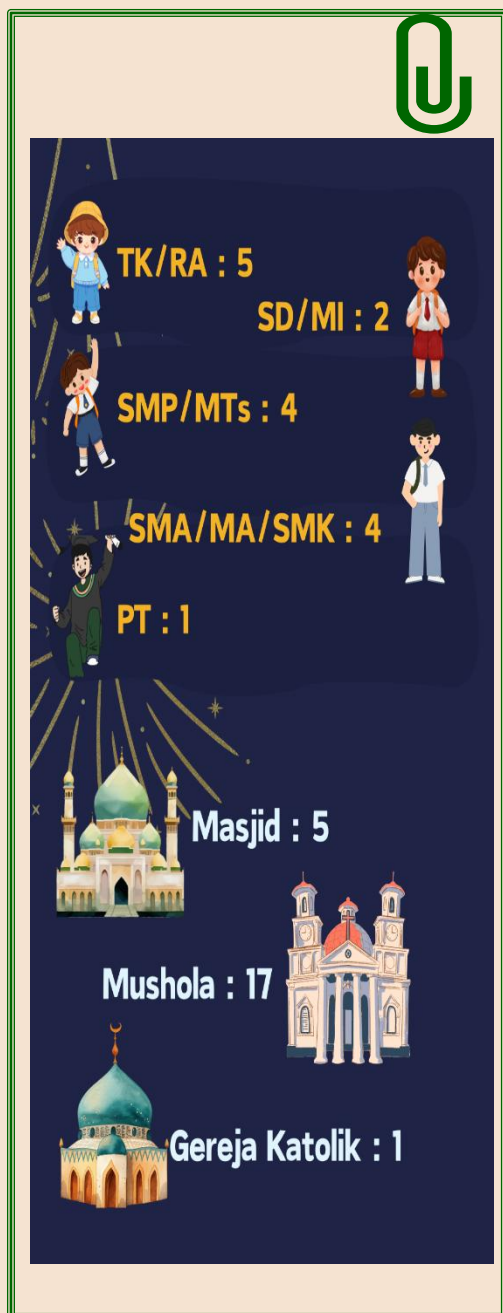
Gambar 2.1 Infrastruktur Pendidikan dan Keagamaan Desa Sukaraja, 2025

Pendidikan merupakan salah satu tolak ukur kualitas sumber daya manusia (SDM) di suatu wilayah. Tinggi atau rendahnya kualitas SDM akan sebanding dengan ketersediaan sarana dan prasarana pendidikan di wilayah tersebut.