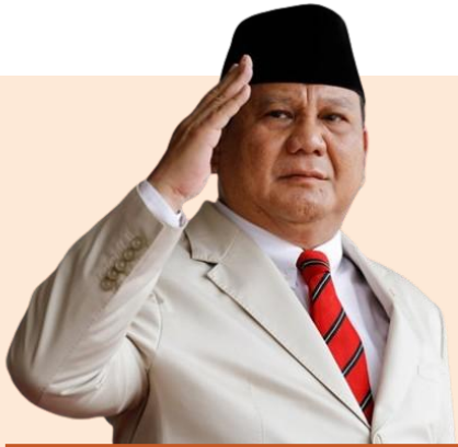
Asta Cita: 8 Misi Pemerintahan Prabowo-Gibran

Desa Sebagai Subjek dan Ujung Tombak Pembangunan Indonesia